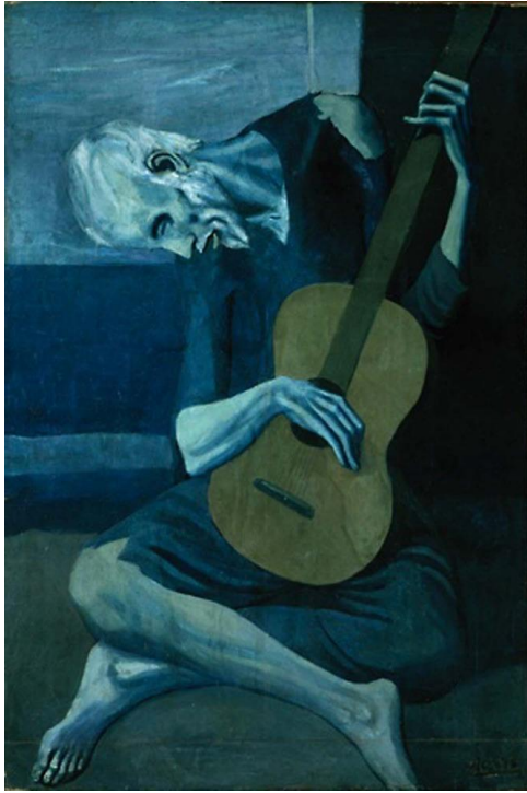
P. PICASSO 'De Oude Gitarist'