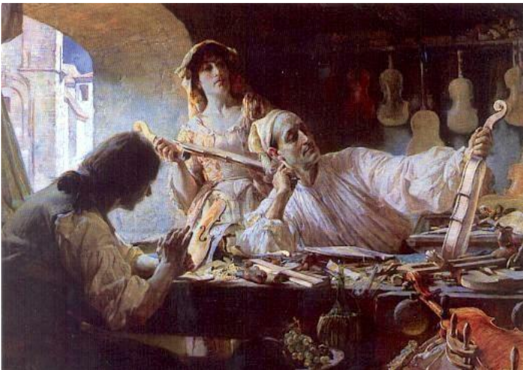
E.BUNDY 'Stradivari at work in his studio' (1893)